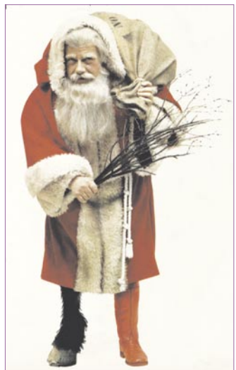
Drogen gefällig ... ?

Menschen organisieren sich in Vereinigungen wie Amnesty international, Umweltschutzverbänden, Vereinen zur Selbsthilfe und Interessenvertretung von Behinderten und