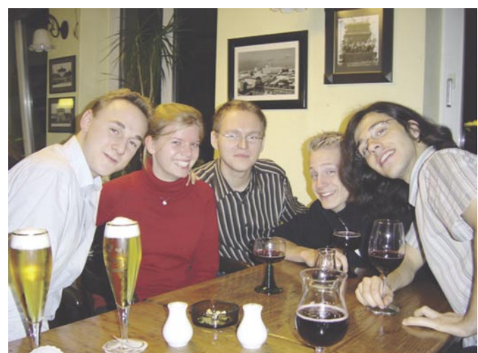
Nach der Bundes- die Lokal-Politik – ohne Sperrstunde! Wir bei der „Arbeit“ (ganz rechts ich)