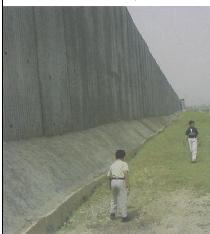
Spielen im Schatten der Mauer - Qalqilya District, April 2003