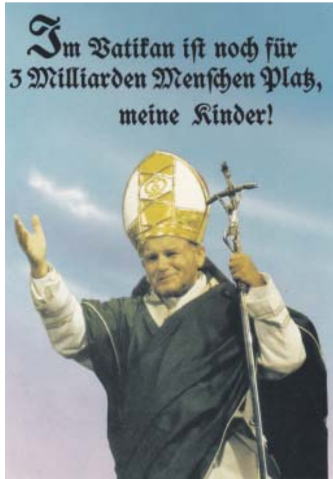
Klaus Staeck (1991) „Der Quartiermeister“

Keine der Religionen verheimlicht die Gebrechen der diesseitigen Welt und ihrer Menschen. Wer die Bibel liest, erfährt ungeschminkt menschliche Realität, vom Lächerlichen bis zum Erhabenen, vom Sanften und Rührenden bis zum Schrecklichen und Barbarischen, von der innigen Liebe bis zum tödlichen Haß Von Kain und Abel bis zum Kreuzestod Christi durchzieht die Bibel eine einzige Kette von menschlichen Miserabilitäten, gegen die so manches Skandalon unserer Tage eher harmlos anmutet. Trotz oder wegen dieses Wissens