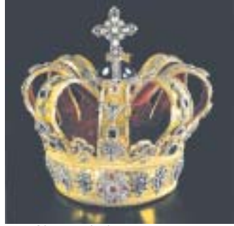
Großherzogliche Krone mit Juwelen des 18. Jh.: Gold, Silber, Rubine, Smaragde, Saphire, Diamanten, Brillanten(1811). Badisches Landesmuseum Karlsruhe

chie aufgewertet werden sollten. In diesen Zusammenhang gehört die Auflösung der Kurpfalz, die seit der Zeit Carl Theodors mit Bayern verbunden war. Nahezu unbemerkt verschwindet die alte Kurpfalz von der politischen Landkarte und wird badisch. Markgraf Karl Friedrich von Baden erhält 1803 den Titel des Kurfürsten. Seit 1806 Großherzog, gliedert er die ehemals kurpfälzischen Gebiete dann schnell in seinen vergrößerten badischen Staat ein – er ist in der ehemaligen Kurpfalz nicht unbeliebt. Zeugnis der probadischen Stimmung in Heidelberg