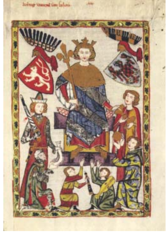
Jede Wette: Wer dieses Bild aus der „Manesse“, die in der Heidelberger Uni-Bibliothek im Original als „Schatz“ gehütet wird, hat es faksimiliert oder als Druck gesehen.

Doch das "Kalb" ist mit dem "Kuh" nicht identisch der äußeren Gestalt nach, denn was fleißige Hände in den Scriptorien schreiben und illuminieren, wandelt sich im Verlauf des handwerklichen und künstlerischen Pro-