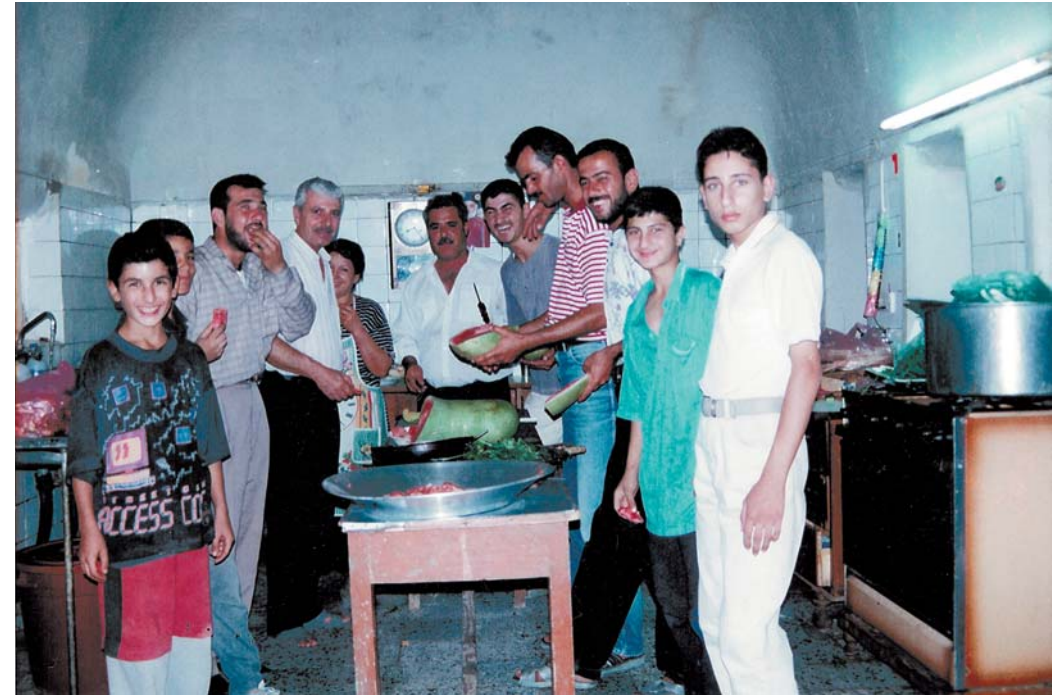
Das Leben in der Partnergemeinde geht weiter – nicht, als ob nichts gewesen wäre, der Krieg hat auch hier Spuren hinterlassen. Wir können jetzt tatkräftig mithelfen, Caritas hat ein Spendenkonto eingerichtet: HD-Volksbank, BLZ 672 900 00, Kto.-Nr. 29 44 41 02, Stichwort Mosul-Ninive

Jemand hat mich gefragt, ob es wahr ist, daß „die irakischen Menschen in den Straßen von Baghdad getanzt haben“ als das World Trade Center einstürzte. Natürlich ist das nicht wahr. Ich sah ungläubig auf den Fernseher – sah die Reaktion der entsetzten Menschen. Ich tanzte nicht,