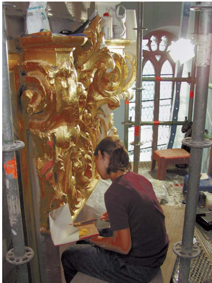
Die Restauratoren bringen an den Kapitellen in schwindelnder Höhe das Blattgold auf.