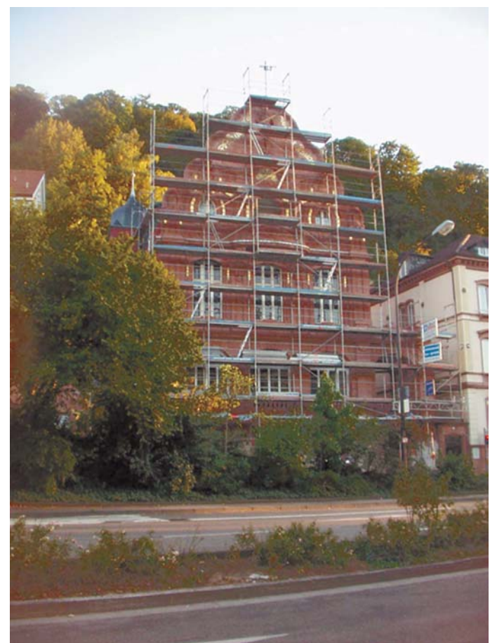
Über dem Gipfelpunkt der Friedrich-Ebert-Anlage steht in der Klingenteichstraße das 1905 von dem Mannheimer Architekt Tillesen errichtete Verbindungshaus Corps Suevia, das mit seiner durchgehenden Sandsteinfassade in der Reihe der umgebenden Gebäude auffällt. Sei April dieses Jahres wurden Fassade und Schieferdach renoviert, sadaß dieses denkmalgeschützte Haus nunmehr wieder in seinem alten Glanze erstrahlt.