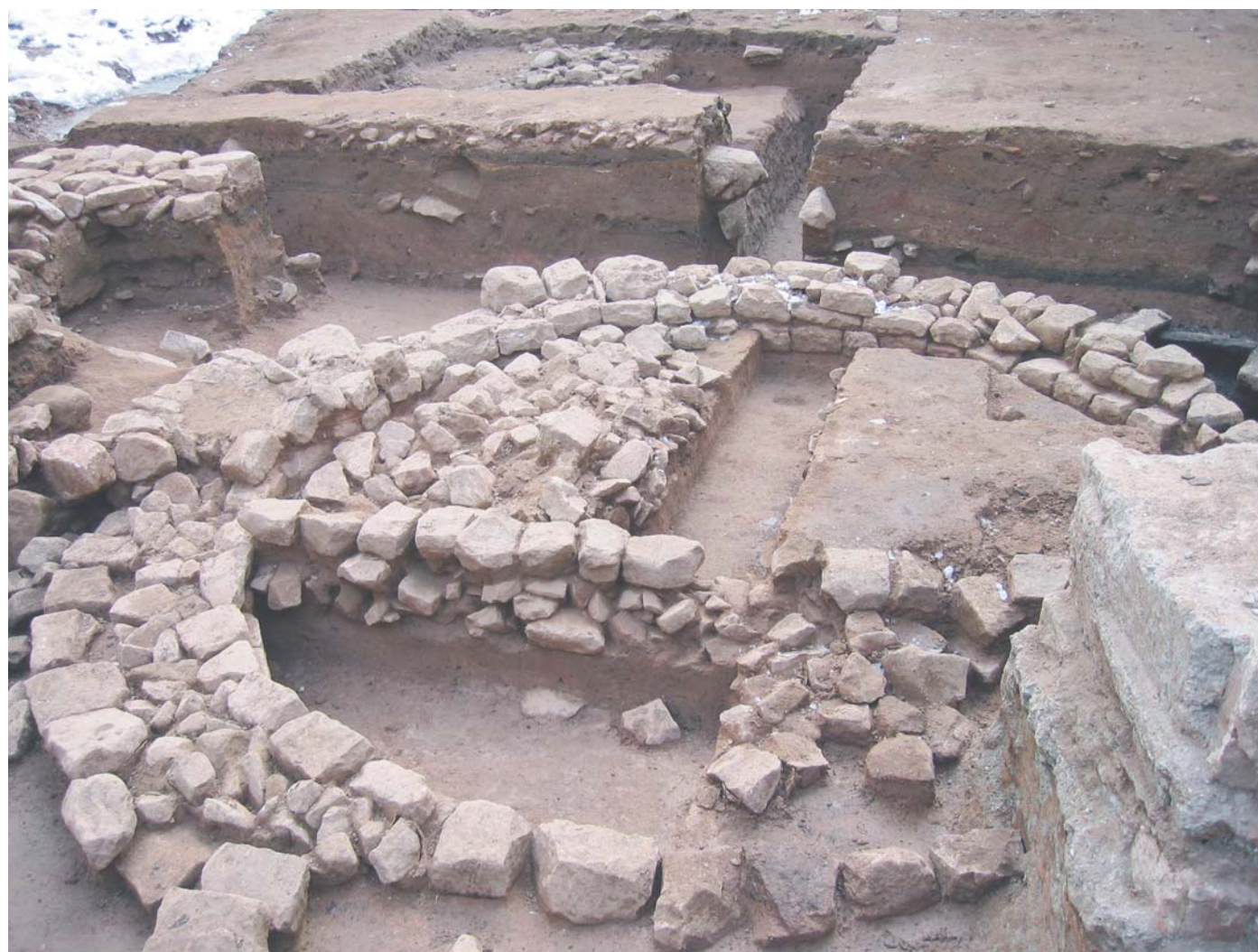
Ästhetik der Steine, vieles andere konnte nur vermutet werden. Daß es sich hier nicht um die Apsis einer Kirche handelt, konnte lediglich deshalb als erwiesen gelten, weil die Steine in die „falsche Richtung“ weisen.

Da dies immer mit der Zerstörung der Befunde einhergeht, greift man zu diesem Mittel nur, wenn der völlige Verlust dieser Geschichtsquellen durch eine Baumaßnahme unabwendbar ist, wie hier im Winkel von Grabengasse und Seminarstraße. Das Grundstück liegt im Bereich des ältesten Siedlungskerns der Stadt. Dieser entstand im 12.