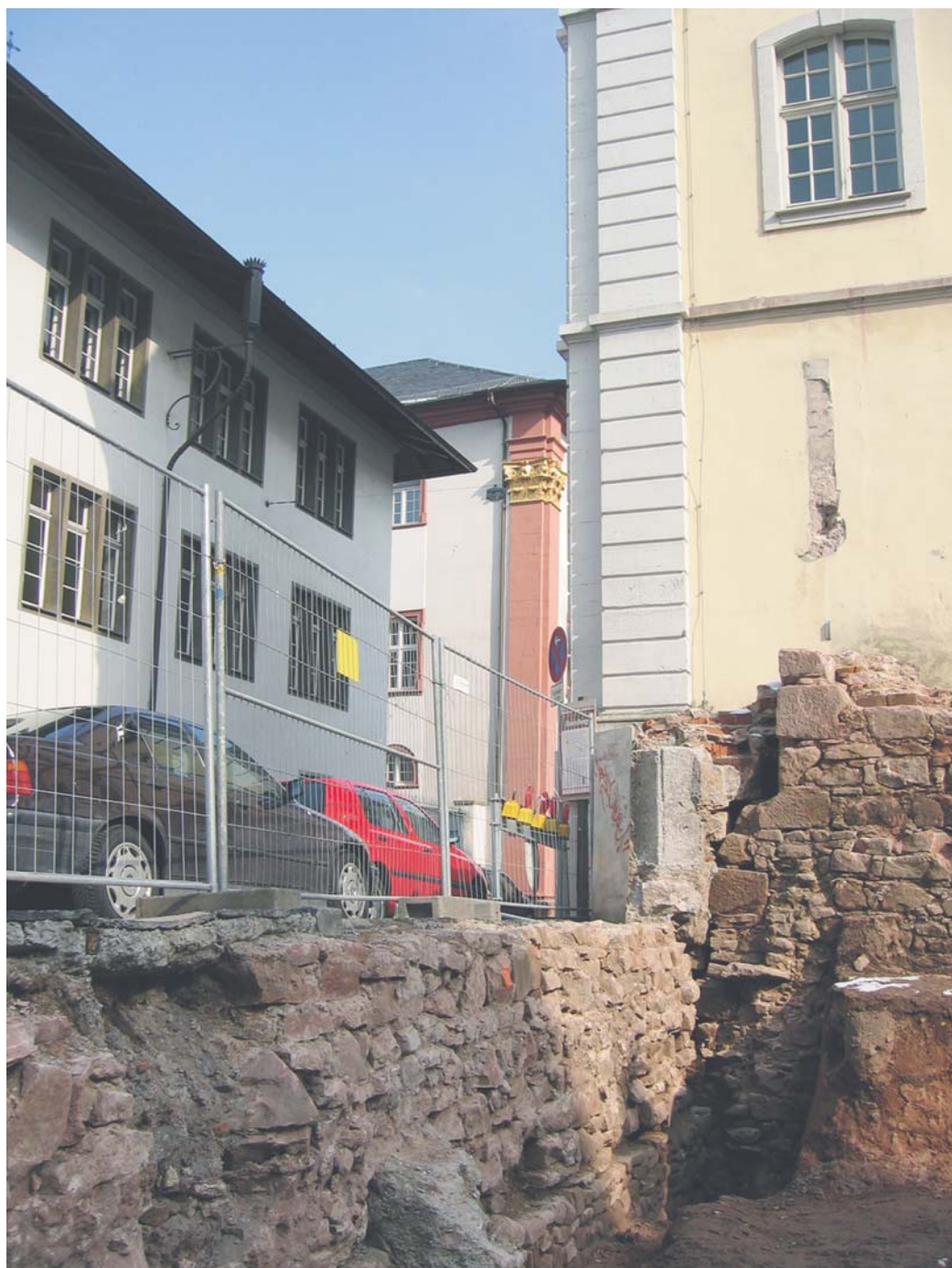
Hier sind wir also: Links die „Neue Uni“, die Stadtmauer (Detail Foto rechts) grenzt ans ehemalige „CA“ darüber sehen wir Reste eines „Mälzer-Ofens“ - auch die Archäologen konnten nicht alles zuordnen. Der Bauherr sorgt dankenswerterweise dafür, daß die Stadtmauer zugänglich bleibt.