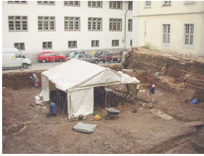
Hier haben erst einmal die Archäologen das Wort. Rechts die freigelegte Stadtmauer, im Hintergrund die „Neue“ Uni.

von einem Politiker selten zu vernehmen ist, er redete vehement einer angemessenen „zeitgemäßen