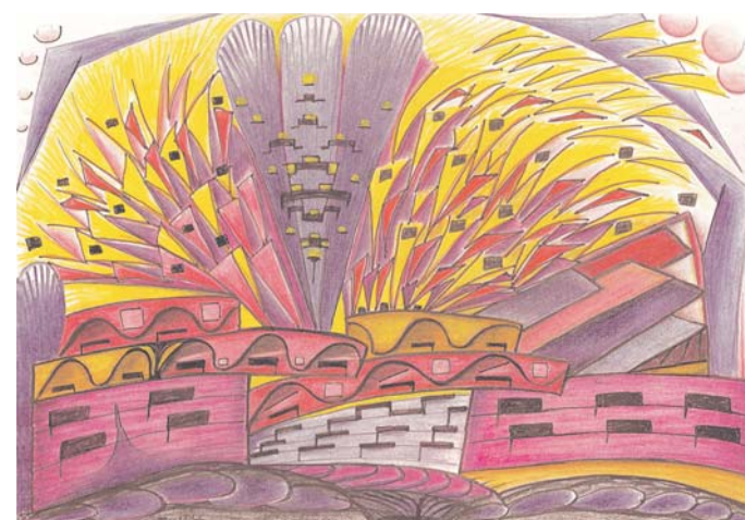
Horowitz spielt Liszt, 1991.