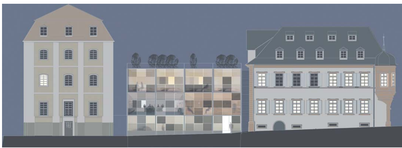
Modernes Bauen in historischem Kontext – nicht nur der Baubürgermeister, sondern auch die Bürger finden das so in Ordnung

Die schriftlich wiedergegebene „Aufregung von Vereinsmitgliedern“ jedenfalls – der geplante Neubau sei „so häßlich“ oder ein „scheußliches Ding“ – war so in