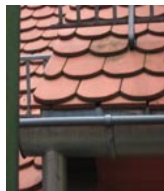
So solls nach dem Willen des Baurechtsamtes aussehen. Notfalls muß abgesägt werden (können) ...

Denkmälmer allüberall in Heidelberg unter anderem mit dem sattsam bekannten „ochsenblutrot“ - oder welche Farbe da immer als die von unseren Schützern und Rettern ganz zu allererst aufgetragene Farbe am