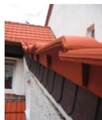
... diese Ziegel hingegen können - obgleich genehmigt - nicht gesägt werden. Müssen aber. Hier weiß die Rechte nicht, was die Linke tut.

gestellt wird: „Kann die Denkmalpflege entstaatlicht werden?“ Die Bundesregierung beauftragte den Architekturkritiker Dieter Hoffmann-Axthelm mit einem Gutachten. Und der lieferte (was Wunder) flugs eine flammende Streitschrift