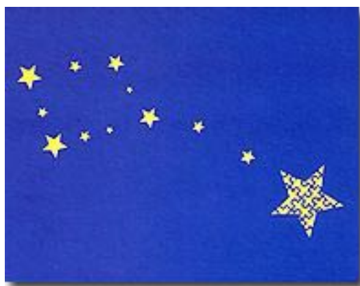
Javier Felipe (Extremadura, Spanien)

sie zu einem Element der Stärke und des Zusammenhalts für die Regionen. Die VRE hat ihren Sitz in Straßburg (F).