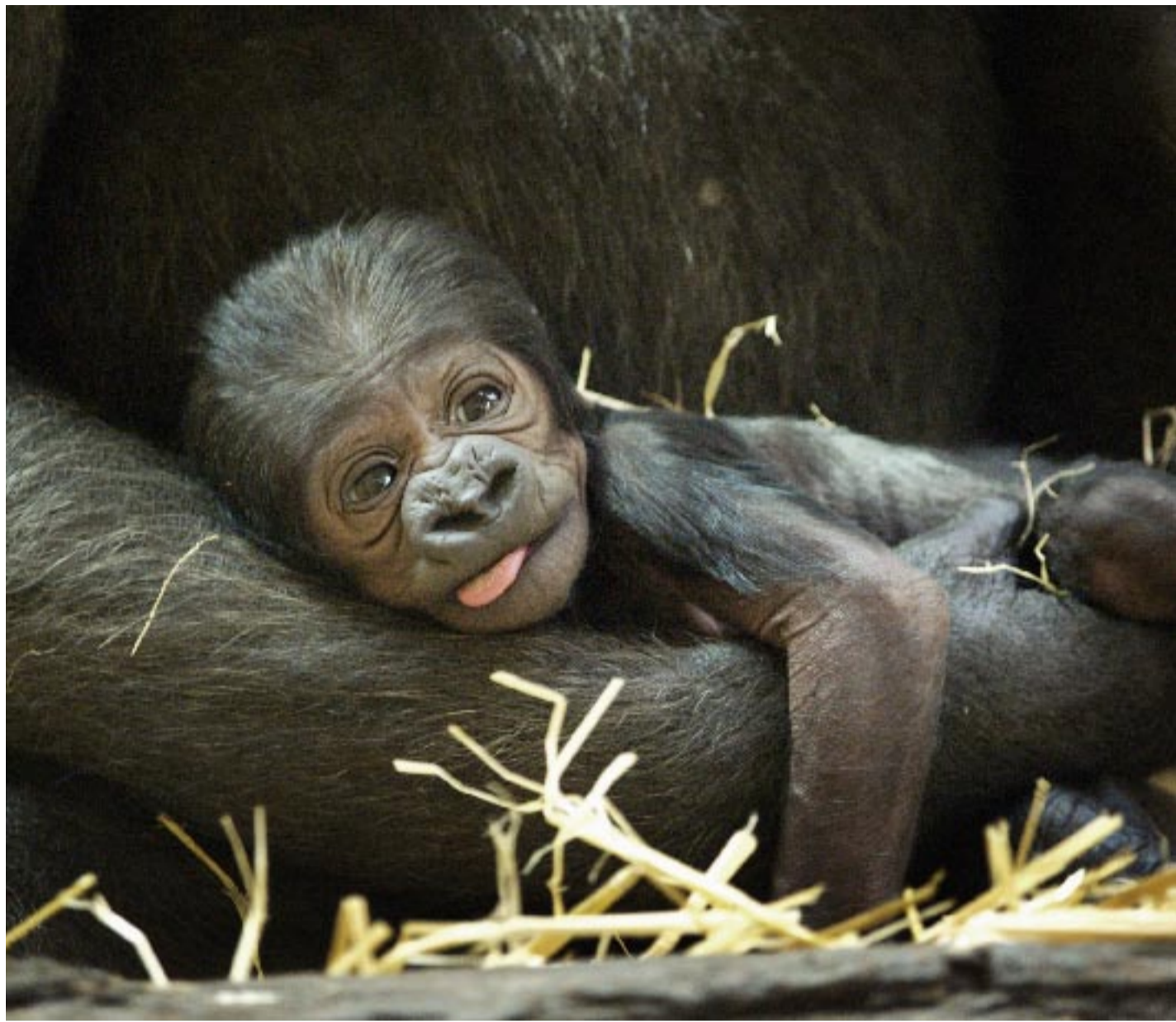
„Im Anfang war das Wort“? Oder wer? Oder wer? Oder wa?

Die Kreationisten, die den biblischen Schöpfungsbericht wörtlich - wortwörtlich - zu nehmen geneigt sind, segeln gegenwärtig auch unter dem zeitgemäßen Banner des „Intelligent Design“; nicht nur in